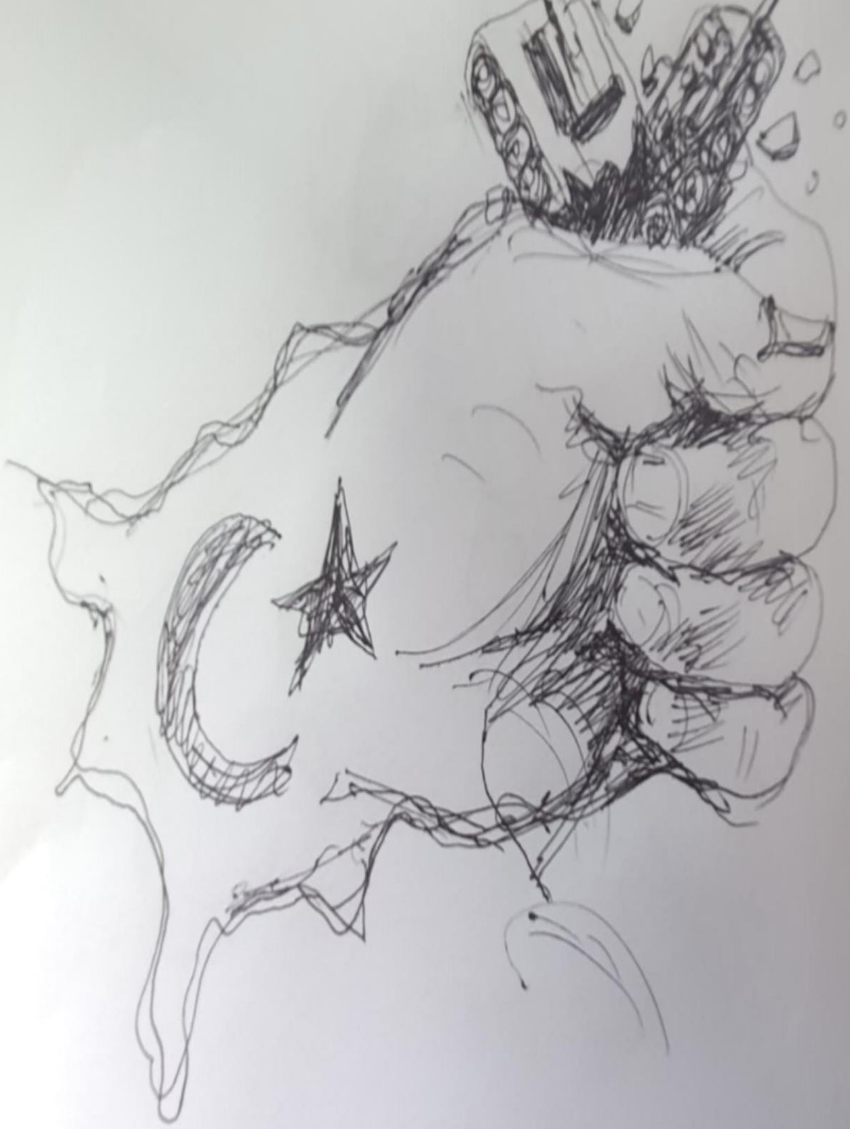
Okulumuz Görsel Sanatlar Öğretmeni Oğuz KAPLAN' ın 15 Temmuz Demokrasi ve Milli Birlik Günü karakalem çalışması görseli.